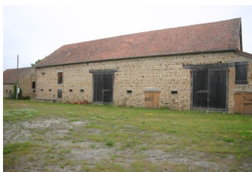
1 Grande Grange de 37m x 12m