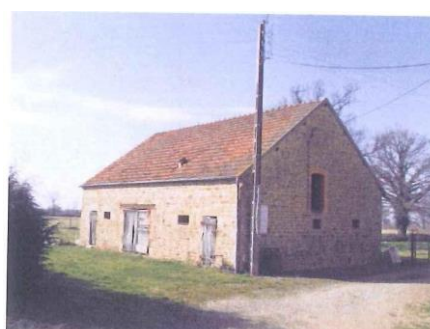
1 Petite Grange de 11m x 8.50m

- 3 Étangs de : 2 ha - 1 ha 20 - 0,63 ha