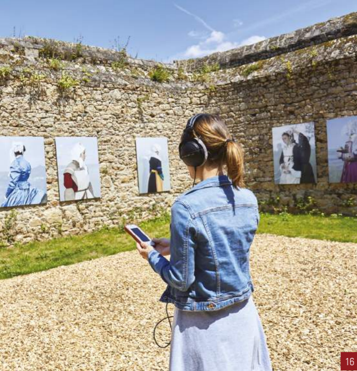
16. Guigamp (Côtes-d'Armor) : Centre d'Art GwinZegal dans l'ancienne prison réhabilitée, 2019