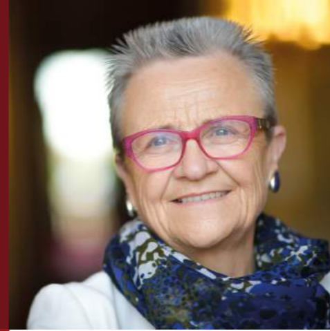
Françoise GATEL